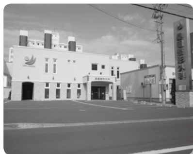
JR桑園駅から徒歩5分の場所に位置し、駐車場も完備。無料送迎バスも運行している