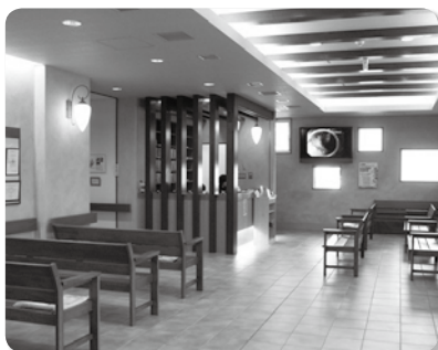
ホテルのロビーを思わせる待合室。院内は、来院者がやさしきや温もりを感じられるように、随所に工夫が施されている

ているほか、入院施設は個室中心で、全室インターネット使い放題とするなどアメニティの充実度も高い。スタッフが常に対話重視の親切、丁寧な姿勢で対応する患者本位の接遇も好評だ。JR桑園駅、地下鉄東西線二十四軒駅、琴似バスターミナル間は無料送迎バスの対応も行う。